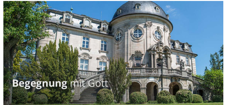
Schloss Craheim, Craheim 1, 97488 Stadtlauringen